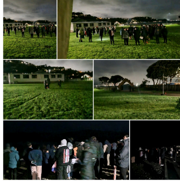
Pure - Hautapu: 22/07/24