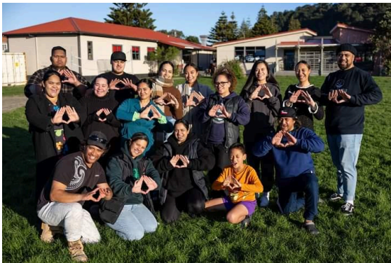
Ngā Raukura o Ngā Mokopuna