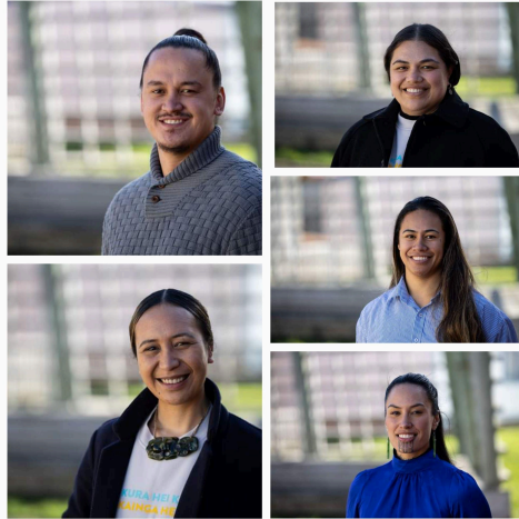
Te Kāhui Kaiako